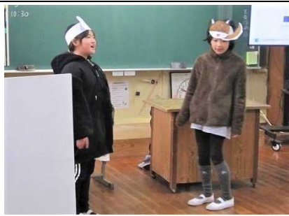
3・4年の外国語活動「Who are you?」。それぞれが動物になってかくれんぼをする劇をしながら英語に親しみました。