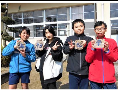
藤工房の方に指導していただき、卒業制作で名前の一文字を記した陶板が焼き上がってきました。色も美しく大満足です。