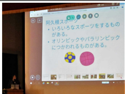
生活・総合発表会。2年生は市内の店を訪ね、見学して分かったことをタブレットにまとめて分かりやすく発表しました。