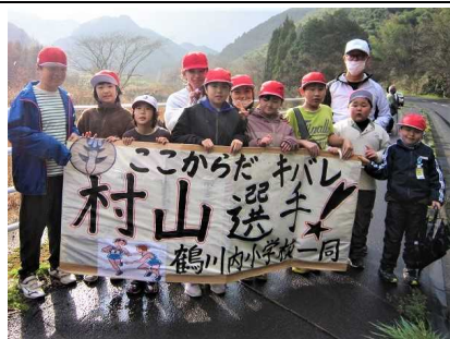
田代の沿道で全地区の応援旗を掲示し、冷たい雨風の中、一生懸命走ってくる選手に全校児童が大声援を送りました。