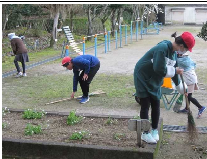
寒い朝のボランティア活動。強風であちこちに散らばった落ち葉を集めています。みんなで協力して校内美化に励みます。