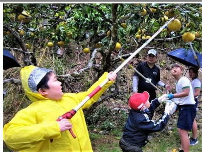
田代でポンタンを栽培されている方の御協力を得てポンタン狩り。大きなポンタンを収穫するのが楽しかったです。